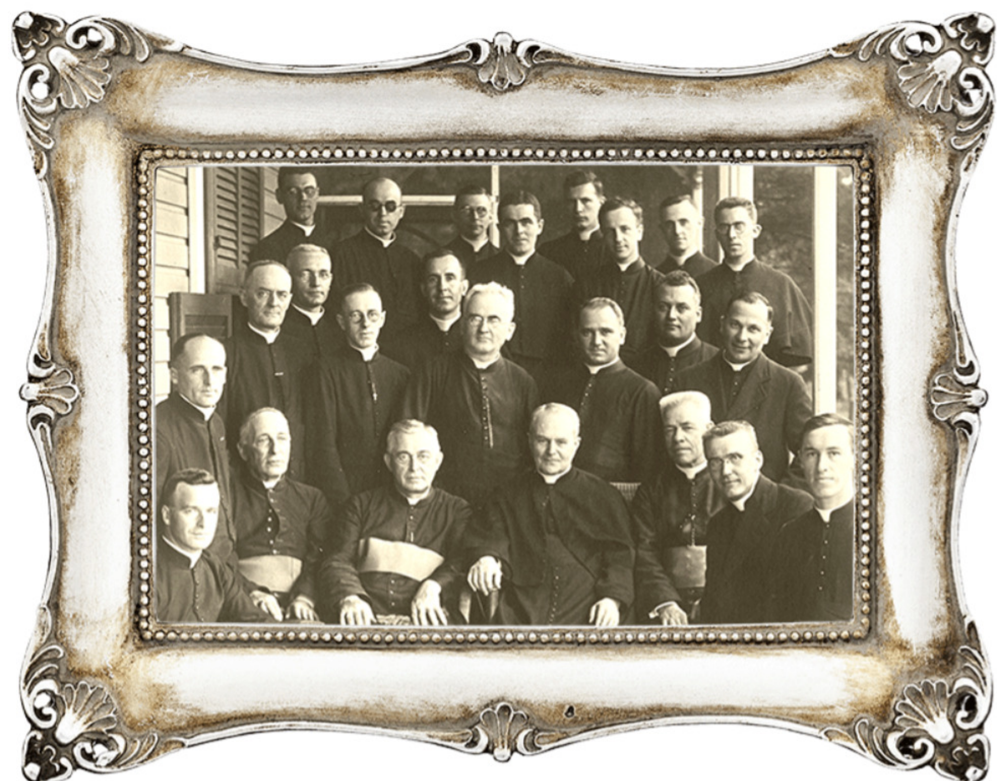
Un prêtre au cœur de feu pour Jésus et ses prêtres!